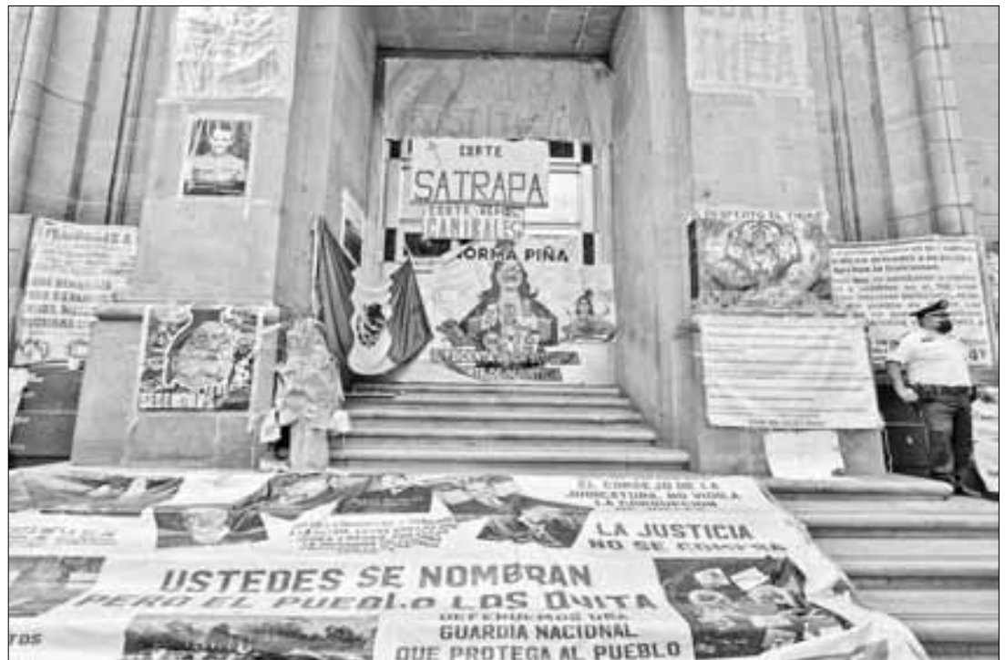
▲ Simpatizantes de Morena mantienen el platón frente a la sede de la SCJN en protesta por el