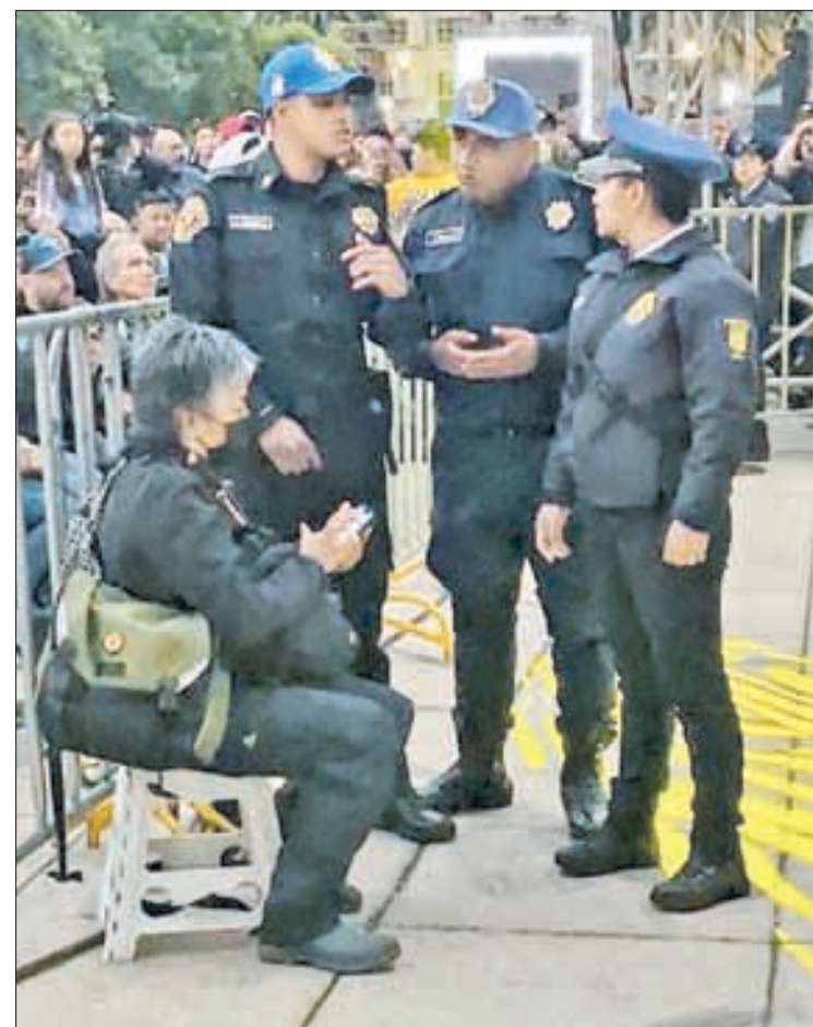
▲ La periodista rodeada de policías.