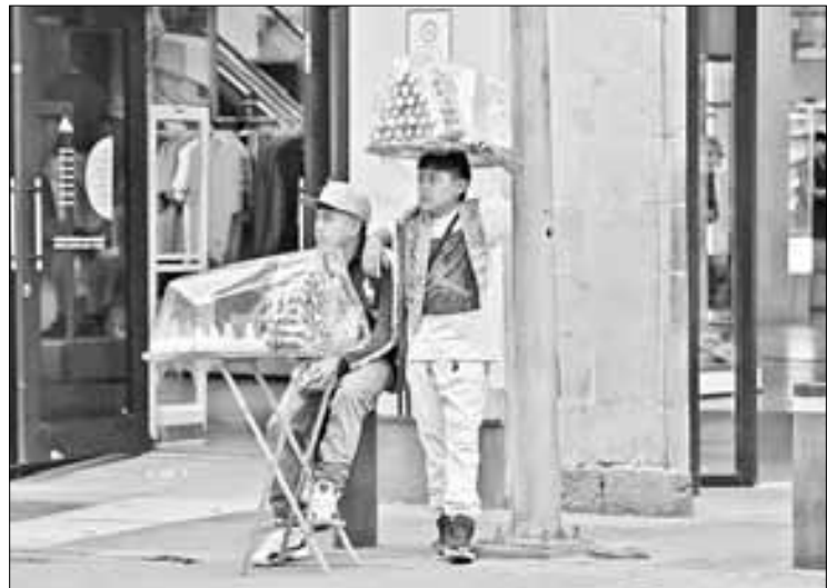
▲ Merengues y gatzates dan color al Centro.