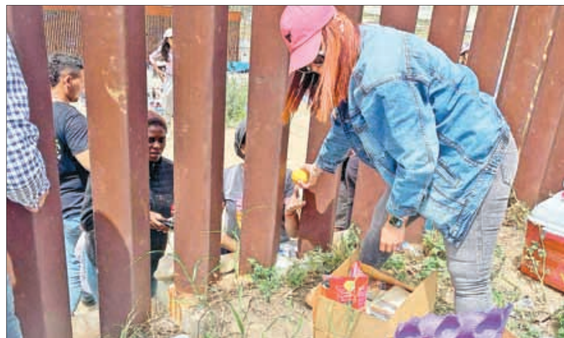
▲ Entre las dos vallas que separan Tijuana de San Diego, continúan cientos de indocumentados en espera de la posibilidad de solicitar asilo.

saron a la aduana estadounidense para una entrevista denominada “de miedo creíble”, en la que un funcionario verifica si huyen de su país por una situación de riesgo verdadero.