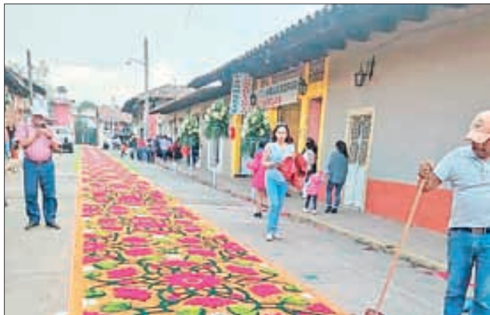
▲ Tapete de aserrín hecho por los pobladores de Acaxochitlán para honrar al Cristo del Colateral.

La última procesión termina en una solemne misa. Luego del acto litúrgico comienza la gran fiesta popular, con lanzamiento de cohetes multicolores, toritos, música y baile.